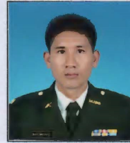
ตัวอย่างลายมือชื่อ

6.3 ควบคุมงานรับลงทะเบียนทหารกองเกินแบบ ออนไลน์